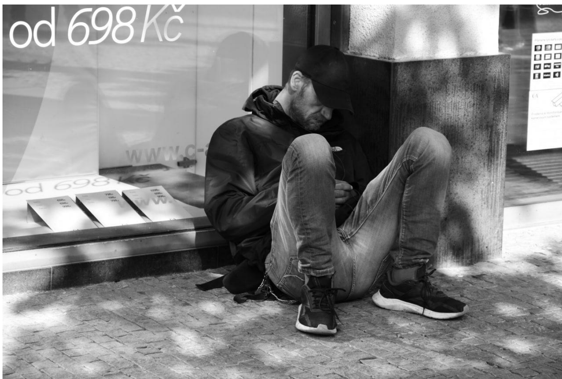
Obrázek 2. Odpočívající №2.