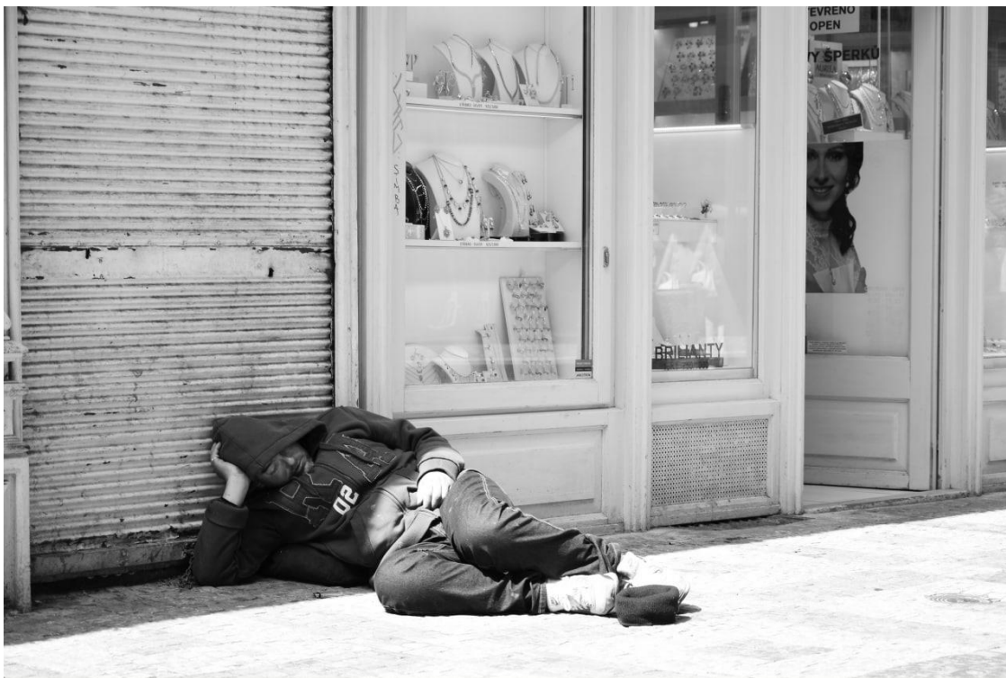
Obrázek 1. Odpočívající №1.

Témata semestrální práce "zrcadlení" a "hrana/na hraně" byla vybrána studenty z několika desítek návrhů a poskytují velký prostor pro fantazii. Zvolení konkrétního tématu a budoucího obsahu však nebylo jednoduché. Na začátku jsem uvažoval o tom, že udělám několik fotografií s lidmi, kteří odpočívají na veřejných místech v Praze a vypadají přitom velmi "na hraně".