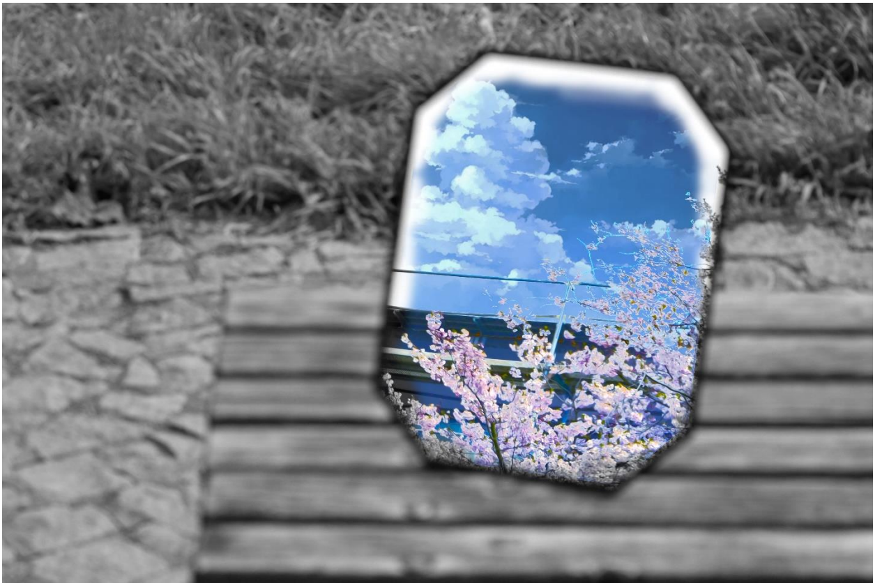
Obrázek 5. Výsledek.