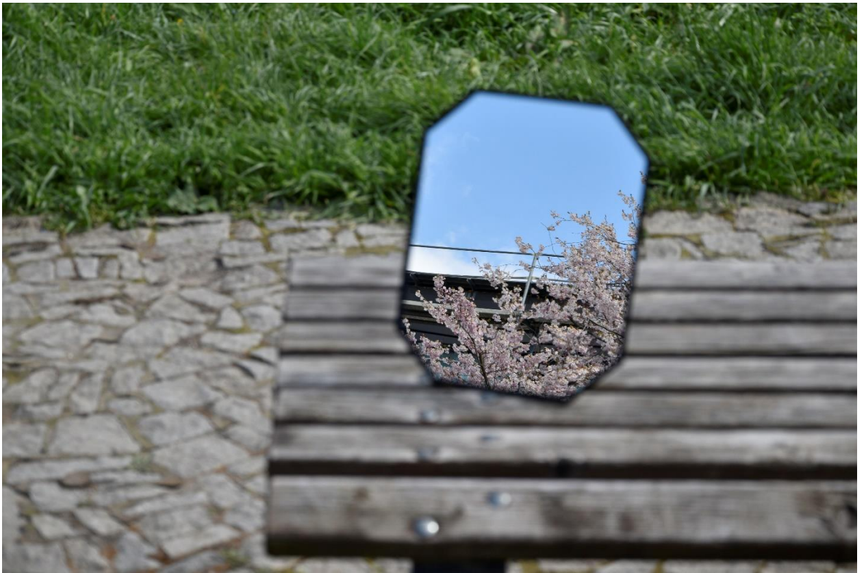
Obrázek 4. Originál.