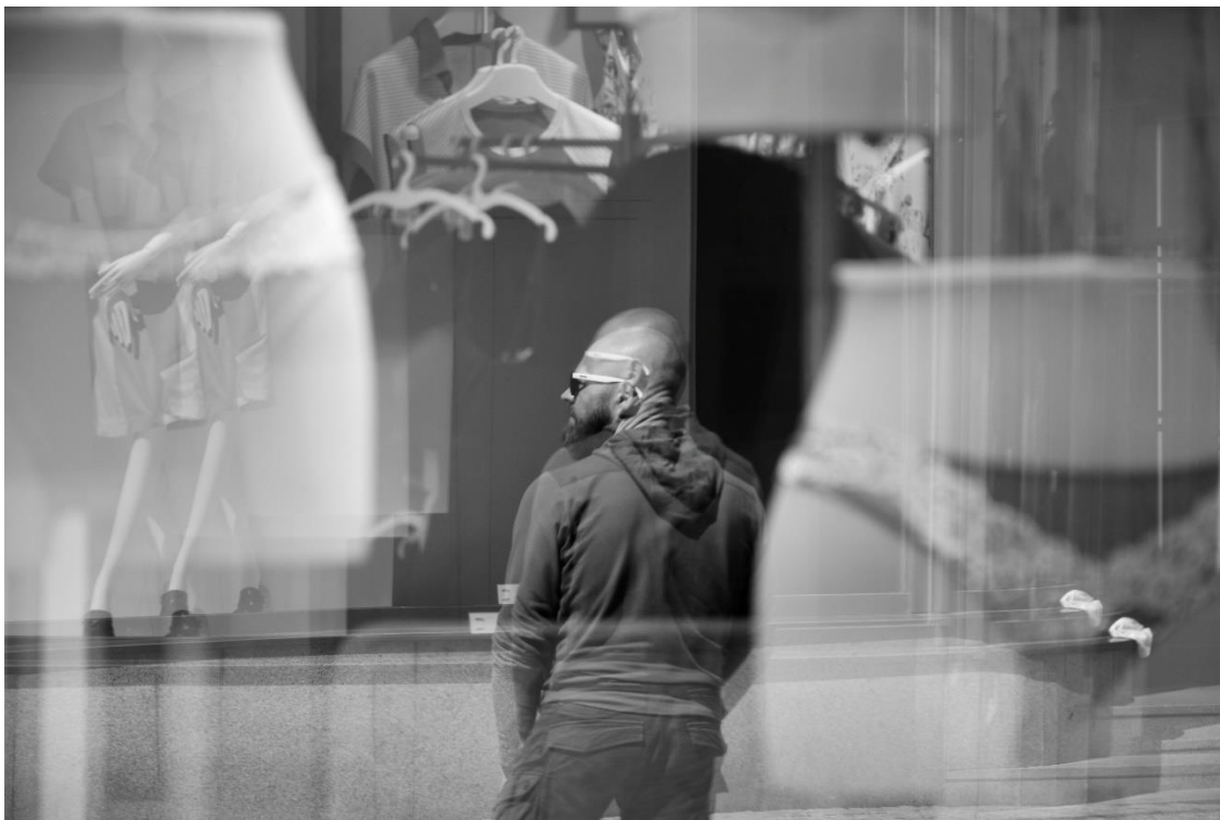
Obrázek 6. Zrcadlení (bonus).

Když jsem se podíval na konečný výsledek, vůbec jsem nepochopil, proč tam musí být zrcadlo. Vypadalo to, jako by bylo příliš zbytečné. Byl jsem zklamán podruhé a šel jsem na procházku po uličkách Prahy, kde mě očekávala tisícovka neopakovatelných zrcadlení od obyčejných skleněných výloh. Tak nakonec vznikl nápad na současný projekt "Černobílá pasáž".