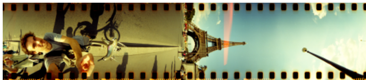
Čtvrtá fotografie: Lomography Spinner 360

U těchto fotografií byly i obrázky fotoaparátů, jež tyto fotky pořídily a mezi nimi i ten, jenž mi už léta zabíral místo v šuplíku. To byla ale jen část toho, co se dalo v článku najít. Krom těchto fotoaparátů, byly přítomny ještě stroje s „rybím okem“, barevným bleskem, možností vyfotit snímek s rotací o 360°, stroj se čtyřmi objektivy vedle sebe nebo dokonce s osmi i devíti objektivy.