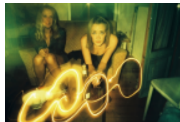
Třetí fotografie: Color Splash.