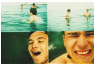
První fotografie: Action sampler.

Narazila jsem před nedávnem na článek, který nesl název: Lomografie je fenoménem retro fotografií i aparátů. Protože se o focení zajímám, tak jsem četla dál a uviděla něco, čemu jsem nemohla uvěřit. Byly tam fotografie, jež se skládaly ze čtyř menších, a každá byla vyfocena v jiný čas – zaznamenávaly tak jakýsi filmový pás o čtyřech políčkách.